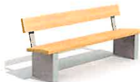
Banc avec dossier Beta