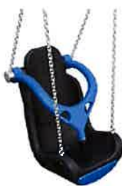
Siège de balançoire inclusif