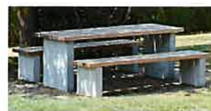
Table et bancs Beta