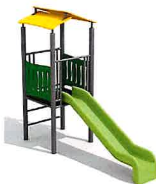
Maisonnette + toboggan