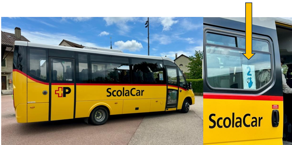
Le bus PERROQUET, No 2, 33 places