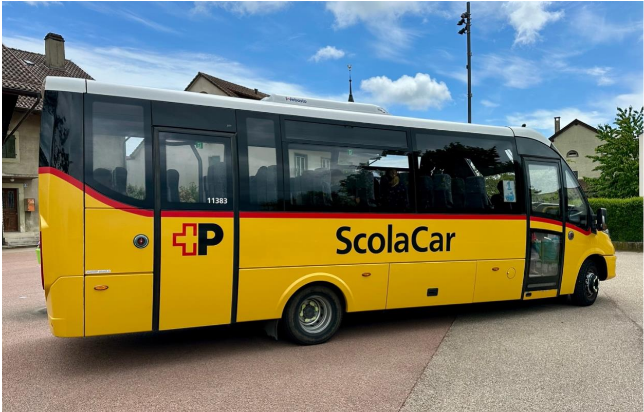
Bus BALEINE, no 1, 47 places

À noter qu'il y a 3 ans, un sondage sur l'introduction d'un horaire continu a été mené par le Conseil d'établissement : les parents s'y étaient opposés, le modèle actuel a donc été maintenu.